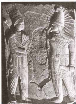
Рис. 8. Рельеф из Коммагены. Царь и Митра

Пятая схема – Митра стоящий фронтально на колеснице, влекомой двумя или четырьмя конями. Древнейшее известное подобное изображение (IV в. до н.э.) происходит из Южной России, из кургана Карагодеуаш, как указывал еще М.И. Ростовцев 165 . Следующее по времени подобное изображение появляется на монетах греко-бактрийского царя Платона 166 . В более позднее время эта иконография Митры засвидетельствована сасанидскими печатями и буллами (некоторые из них имеют надписи, где упоминается Митра) 167 (рис. 9). Показательна также булла из раскопок Ак-депе (Южный Туркменистан) 168 ,