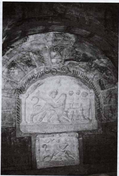
Рис. 2. Митреум в Дуре-Европос. Культурная ниша

лельно собаке. Однако эта деталь изображения некоторое время спустя была стесана и только легкие следы ее видны сейчас. Над Митрой имеются стилизованные изображения Солнца и Луны, а между ними – изображение ворона. Сохранились остатки окраски рельефа. Этот рельеф напоминает многие другие митраистские рельефы. В нем имеется только одна необычная черта – изображение змеи, представленной параллельно собаке, достаточно грубое, но хорошо передающее движение. Отсутствие глубины в рельефе сближает его с точки зрения пространственных построений с дуранской живописью.