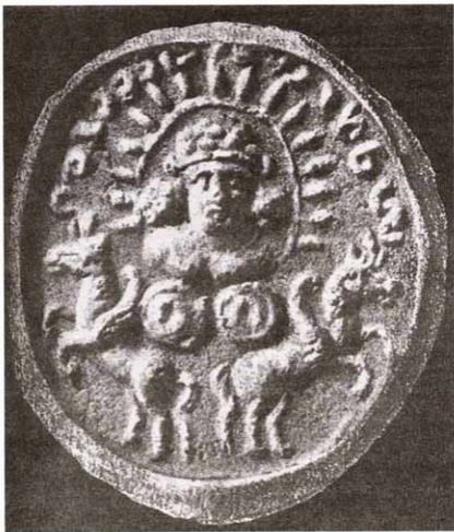
Рис. 9. Сасанидская булла с изображением Митры

поскольку владельцем печати с изображением Митры на колеснице был жрец Митры 169 . Наконец, эта иконографическая схема представлена и в искусстве Согда времени раннего средневековья: в Шахрестане (Уструшана) 170 и в Пенджикенте 171 .