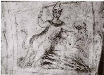
Рис. 5. Митреум в Дуре-Европос. Митра-Тавроктон. Живописная сцена

круг культовой ниши. В основном живопись третьего периода повторяла живопись второго, хотя и с определенными изменениями. Изображенные сцены были небольших размеров, только фигуры «отцов», или «пророков», которые обрамляли культовую нишу (как и на предыдущем этапе), были крупными. Использовались следующие цвета: красный, черный, желтый и белый. Техника исполнения – более простая, чем на предыдущей стадии, совершенно отсутствуют попытки передать светотень. Все лица строго фронтальны. Художественное качество росписей весьма скромное, некоторые фигуры имеют только два цвета: черный и красный 62 . На акросолии имеется подпись художника, выполнившего роспись, – Марей (Mareus) 63 . Он был, по всей вероятности, местным жителем и, может быть, приверженцем культа Митры 64 .