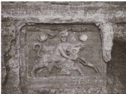
Рис. 3. Митреум в Дуре-Европос. Митра-Тавроктон. Ранний рельеф