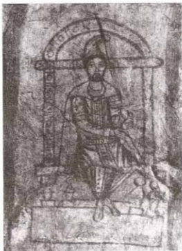
Рис. 6. Митреум в Дуре-Европос. Изображение Зороастра (?)

По обе стороны от арки, как и в более раннее время, находятся два больших изображения «пророков» (или «отцов») 67 . Исследователи подчеркивают уникальность данного сюжета и особое старание, с которым были выполнены эти фигуры. Они изображены сидящими на тронах с высокими спинками в почти фронтальных позах, но их руки и колени немного повернуты в сторону ниши. Одеты они в парфянские туники, шаровары, плащи, ниспадающие за спину, на головах – тиары, напоминающие головные уборы в изображениях Митры 68 . Лица – с подчеркнута большими глазами, короткими бородами и усами. Каждый из персонажей держит в своей левой руке свиток, а в правой – посох (видимо, магический жезл). Скорее всего, эти два изображения представляют собой «портреты» Зороастра (рис. 6), который в Римской империи воспринимался как создатель митраистских мистерий (Porph. De antro muphr. 6), и его ближайшего ученика Остана 69 .