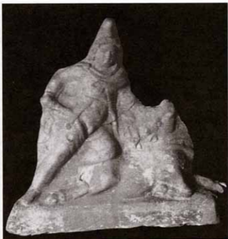
Рис. 10. Боспорское царство. Митра-Аттис. Терракота

ских статуэтках представлен не Митра, а синкретическое божество Митра-Аттис; Митра-Аттис не убивает быка, а только готовится это сделать (есть и другие, более мелкие отличия).