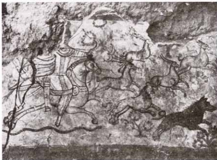
Рис. 7. Митреум в Дуре-Европос. Роспись боковой стены. Митра-охотник

В руках у него большой составной лук, сзади – колчан. Тело лошади – приземистое, с округлыми формами и с непропорционально маленькой головой. Передние ноги лошади «выброшены» вперед – в прыжке, а задние изображены вместе. Художник, видимо, хотел передать галоп. Под ногами лошади изображена змея, скользящая вперед; вероятно, намерение художника состояло в том, чтобы показать ее участие в охоте. Остальные животные в этой сцене (лев, дикий кабан и четыре оленя) представлены также в движении вправо, в позах, напоминающих позу лошади. Лев, несколько напоминающий большую собаку, – также участник охоты и обычный спутник Митры. Все животные (за исключением, конечно, змеи и льва) изображены пораженными стрелами. При этом у двух стрел сломались древка (чтобы показать силу удара). Тела животных переданы округлыми контурами, с четкими линиями и попытками передать светотень. Диагональное расположение двух пар оленей и своеобразные скругленные контуры предполагают свободное движение, то же самое впечатление создает и плащ Митры, развевающийся за его спиной. Исследователи указывают, что эта картина – один из наиболее удачных примеров передачи движения в дуранской живописи 71 . Пейзаж передан стилизованными изображениями растений и цветов, разбросанных по полю.