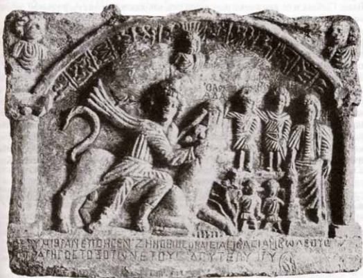
Рис. 4. Митреум в Дуре-Европос. Митра-Тавроктон. Поздний рельеф